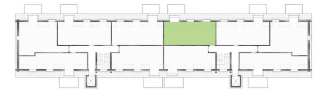
Lage 5-R17 Dachgeschoss